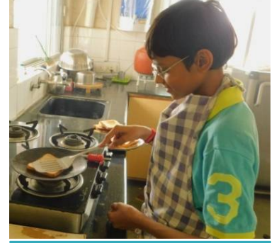
Young people are learning to do all the work themselves

સ્વાવલંબી જીવન જીવવા માટે ઘણી હિંમતની જરૂર પડે છે. કારણ કે જે કામ આપણે ક્યારેય કર્યું નથી અથવા હંમેશાં બીજા પર આધાર રાખ્યો છે, તે કરવા માટે ખૂબ સાહસની જરૂર પડે છે. હાલ ઓએસિસ યુવાનોને ખુમારી ભેર જીવન જીવવાનો મોકો આપી રહ્યું છે; જ્યાં સંઘર્ષોમાં પડવાનો ને તેમાંથી બહાર નીકળીને પોતાની જાતને વિસ્તારવાનો મોકો મળી રહ્યો છે. આમ, ઓએસિસ સ્વાવલંબી જીવન જીવવાની સાચી કેળવણી આપી રહ્યું છે.