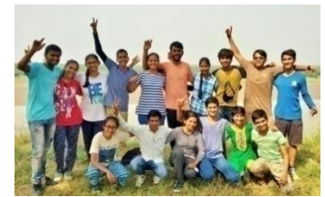
To be smillionaire