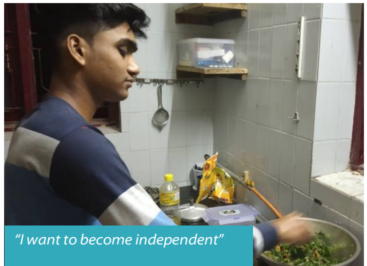
"I want to become independent"