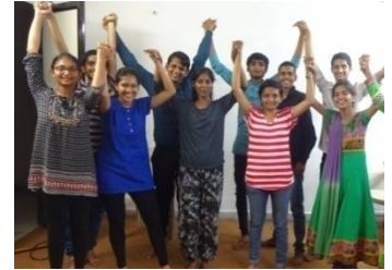
To be Misaal

Here, Honourship is like scholarship or fellowship where financial support is extended to all participants, along with education and training in life oriented themes. It is a 2-5 year residential/ full-time course which focuses on the overall growth of the student to become a true leader in his or her talent area. All other expenses or resources are also provided to the participant. In addition to this, honorarium will be given at the end of completion of 2 years of Oasis Misaal Honourship. Post completion, the participant can pursue any career for the betterment of the nation or be a social welfare entrepreneur.