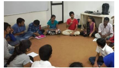
Youths taking decisions in community meeting