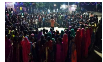
To be dreamer