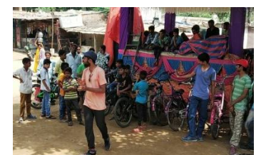
To be a better human being